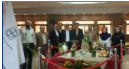
سفر نوروزی رئیس دانشگاه به شهرستان دامغان ۱۴۰۳/۰۱/۰۲