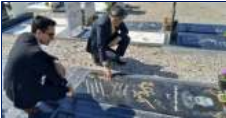
ادای احترام رئیس دانشگاه به شهید مدافع سلامت دانشگاه ۱۴۰۳/۰۲/۰۳