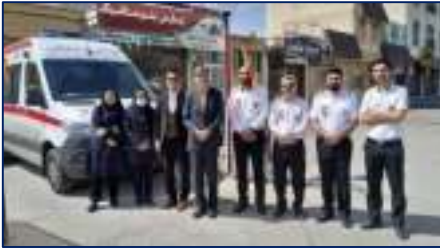
یازدید عیدانه رئیس دانشگاه از مراکز بهداشتی و پایگاه های اورژانس شهرستان های سرخه و سمنان ۱۴۰۲/۰۲/۰۳