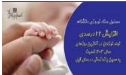
مسئول ستاد نوروزی دانشگاه علوم پزشکی استان سمنان:

کاهش ۲۸/۵ درصد فوتی های ناشی از حوادث ترافیکی در ۱۱ روز نخست طرح نوروزی ۱۴۰۳ نسبت به مدت زمان مشابه سال قبل ۱۴۰۳/۰۱/۰۵