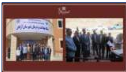
ستاد شبکه بهداشت و درمان شهرستان آزادان و سرای پزشکان شهرستان مهدیشهر افتتاح شد ۱۴۰۲/۰۱/۳۰