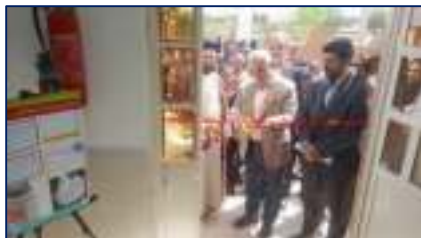
افتتاح خانه ها بهداشت چشمه نادى و رشمه شهرستان گرمسار توسط معاون بهداشتی وزیر بهداشت ۱۴۰۳/۰۱/۳۰