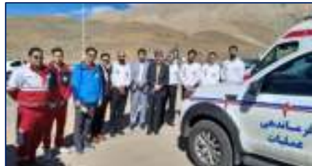
ارزیابی نحوه ارائه خدمات بهداشتی و درمانی شهرستان مهدیشهر توسط رئیس دانشگاه علوم پزشکی استان سمنان ۱۴۰۳/۰۱/۰۲