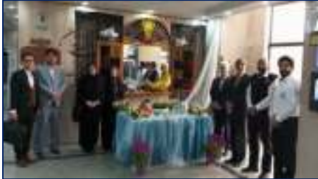
بازدید و دیدار نوروزی رئیس دانشگاه با کارکنان مراکز بهداشتی، درمانی و پایگاه های اورژانس پیش بیمارستانی شهرستان سمنان ۱۴۰۳/۰۱/۰۱