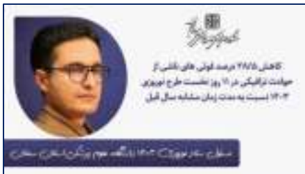
مسئول ستاد نوروزی دانشگاه علوم پزشکی استان سمنان:

کاهش ۲۸/۵ درصد فوتی های ناشی از حوادث ترافیکی در ۱۱ روز نخست طرح نوروزی ۱۴۰۳ نسبت به مدت زمان مشابه سال قبل ۱۴۰۳/۰۱/۰۵