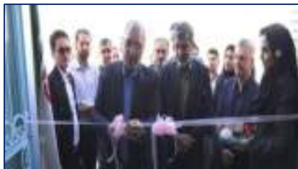
وزیر بهداشت پارک علم و فناوری سلامت دانشگاه علوم پزشکی استان سمنان را افتتاح کرد ۱۴۰۳/۰۱/۳۰