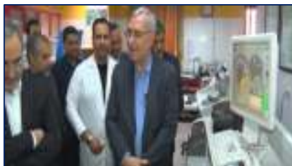
بازدید مقام عالی وزارت بهداشت از مرکز جامع پیشگیری و درمان سرطان استان سمنان ۱۴۰۳/۰۱/۳۰