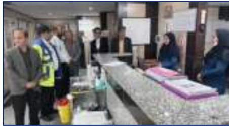
سفر نوروزی رئیس دانشگاه به شهرستان های گرمسار و آزادان در راستای بررسی روند ارائه خدمات در ایام نوروز ۱۴۰۳/۰۱/۰۱